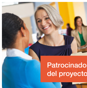
Patrocinador del proyecto