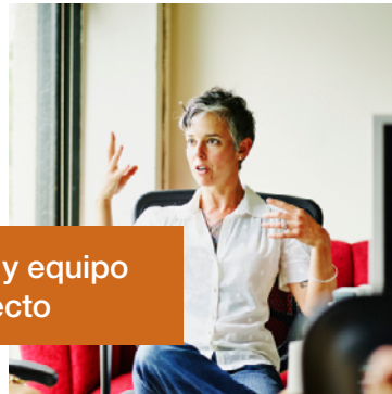
Director y equipo de proyecto