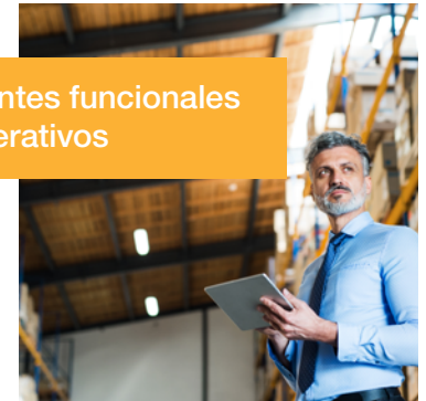
Gerentes funcionales u operativos